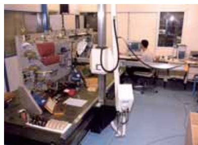
3次元コントロール