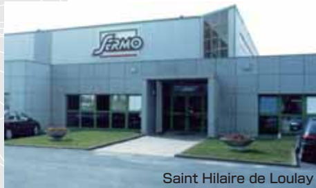
Saint Hilaire de Loulay